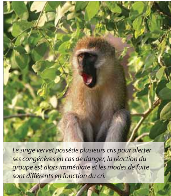
Le singe vervet possède plusieurs cris pour alerter ses congénères en cas de danger, la réaction du groupe est alors immédiate et les modes de fuite sont différents en fonction du cri.

Les chercheurs se sont également posé la question de la syntaxe, de l'ordonnement des énoncés. Car il est clair que, selon leur agencement combinatoire, les mêmes lexèmes peuvent traduire des idées parfois très différentes. « Le chien a mordu l'enfant » se distingue nettement